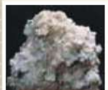
チクガが害母・益害両母

淡褐色～淡紫褐色、半透明の六角板状結晶。この害母が存在する晶洞からは、よくトパーズが見つかります。